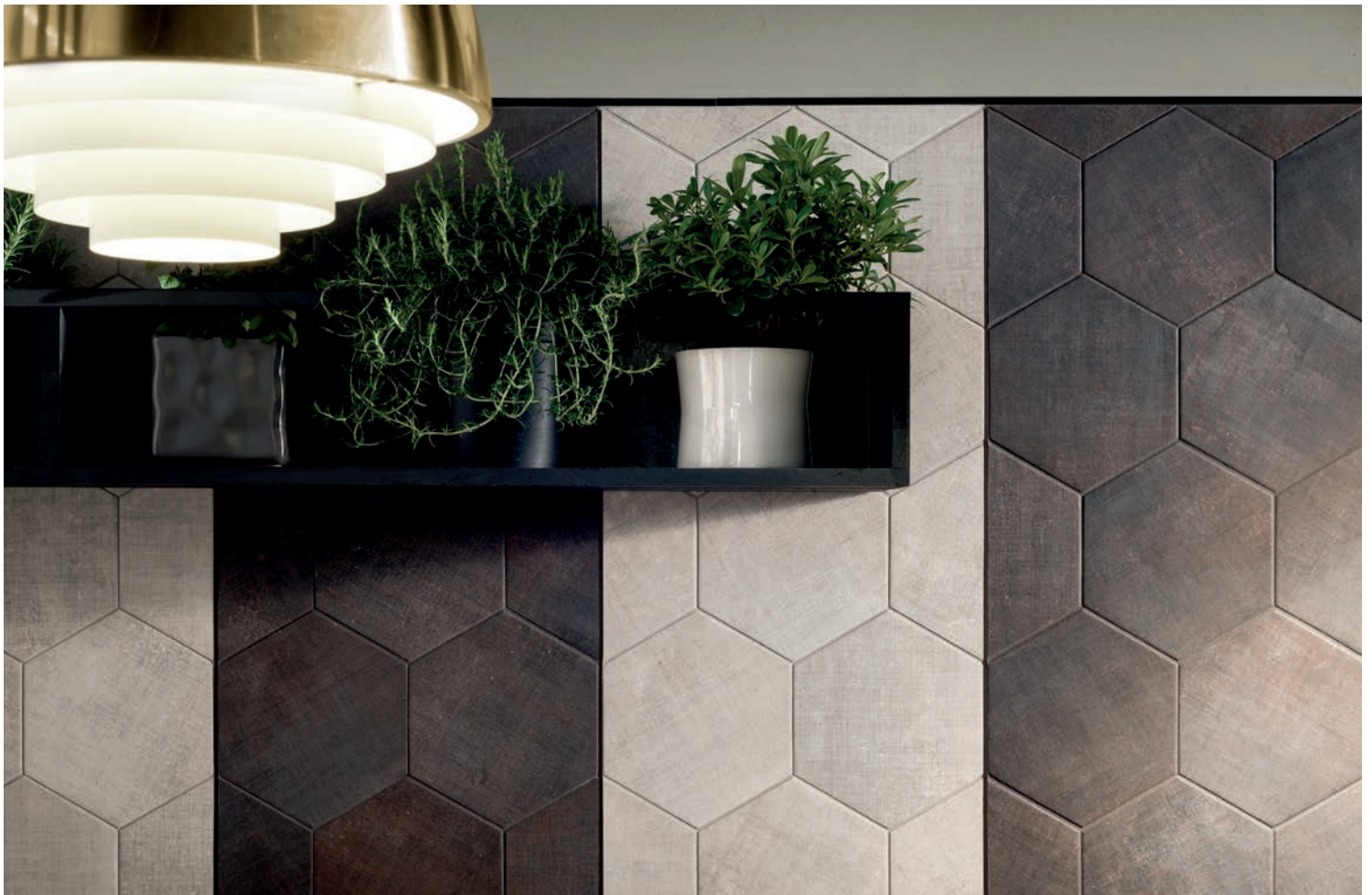
ARGENT & DARK