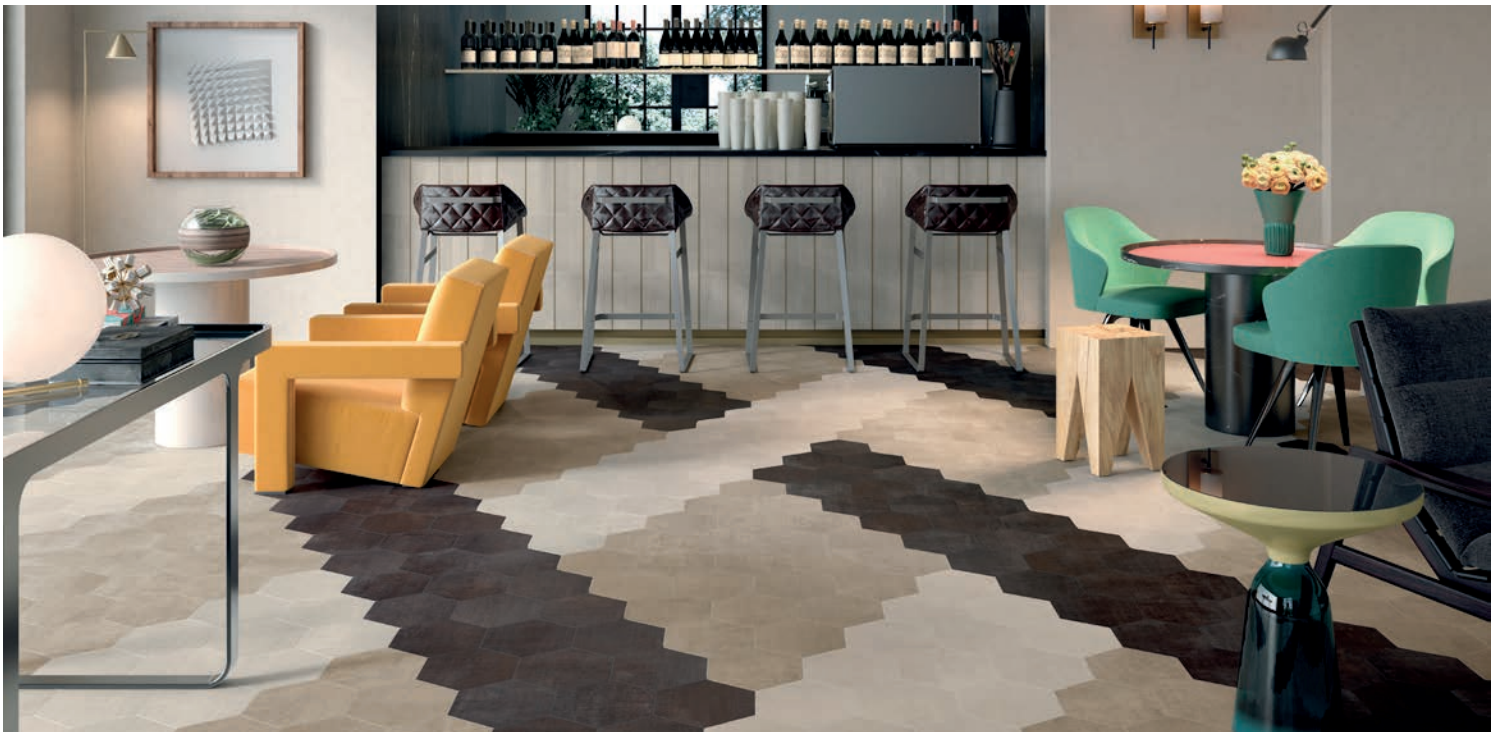
IVOIRE, SABLE & DARK