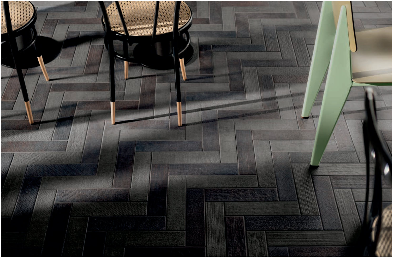
TAUPE & DARK